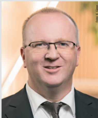
Ralf Gutheil, Bürgermeister der Stadt Bad Wildungen