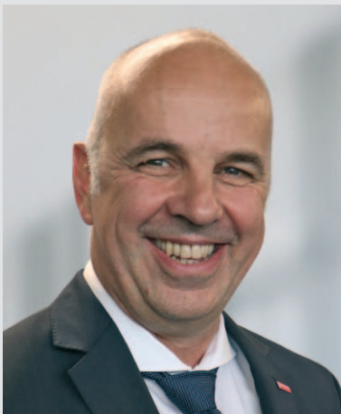
Stefan Füll, Präsident des Hessischen Handwerkstages