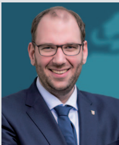
Jan-Wilhelm Pohlmann, CDU-Fraktion im Deutschen Bundestag