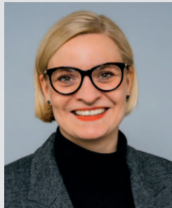
Cirsten Kunz-Strueder, SPD-Fraktion im Hessischen Landtag