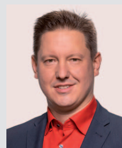
Hannes Walter, SPD-Fraktion im Deutschen Bundestag